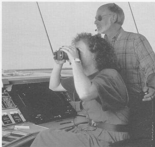
■ Contrôle de la circulation aérienne et systèmes d'atterrissage aux instruments

Au-delà de l'étroite ceinture sud du Canada, notre pays est vaste et sa population est éparpillée. En conséquence, les Canadiens sont par nécessité de grands usagers de tous les types de services radio. En outre, la croissance régulière de nos agglomérations urbaines a accru la demande d'utilisation des fréquences disponibles, compliquant ainsi la tâche des gestionnaires du spectre soucieux d'assurer à un aussi grand nombre d'usagers que possible, l'accès dont ils ont besoin.